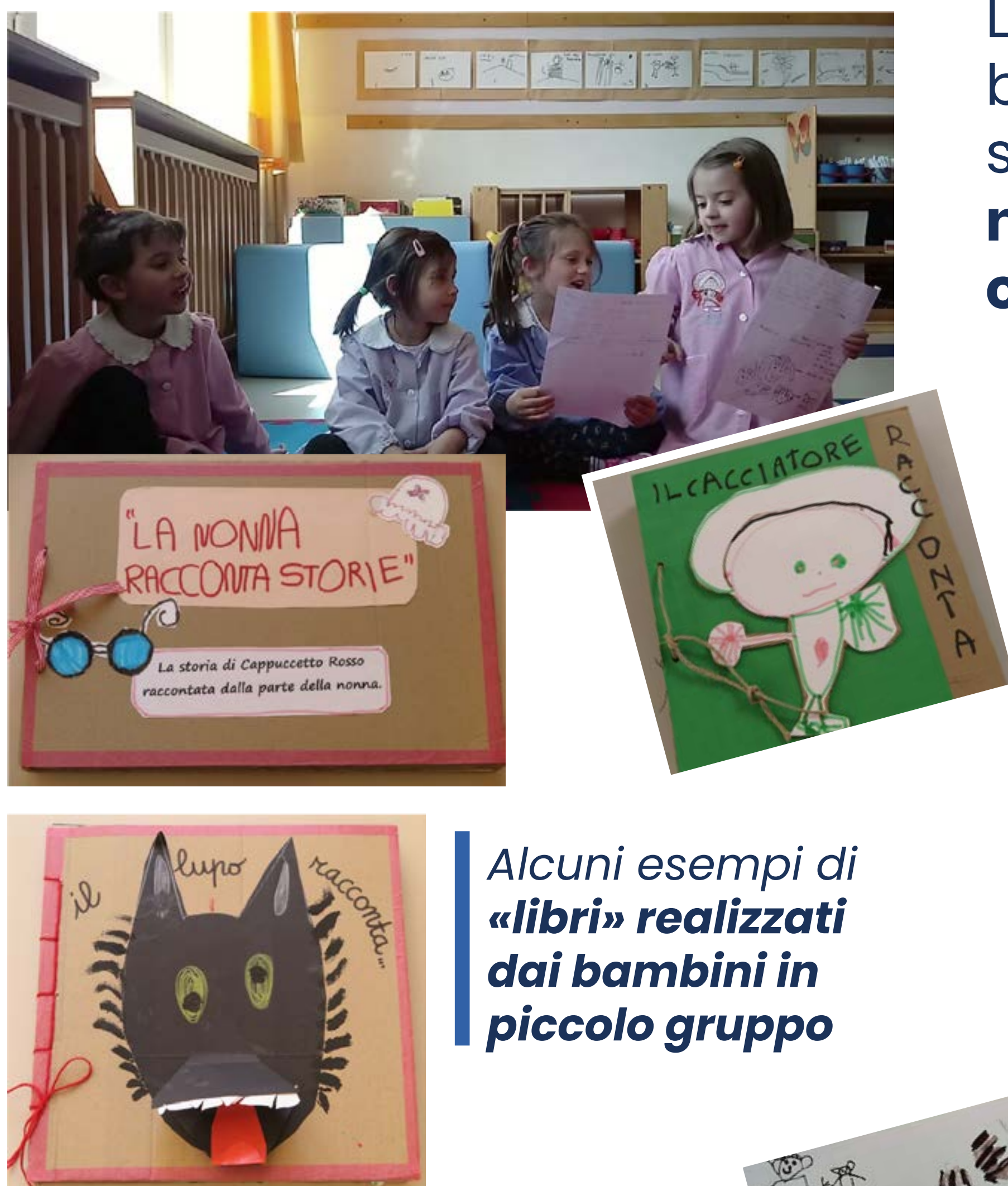
Alcuni esempi di «libri» realizzati dai bambini in piccolo gruppo

Partendo dalla storia tradizionale di Cappuccetto Rosso , i bambini in piccolo gruppo hanno rielaborato la trama narrativa, assumendo il punto di vista dei tre personaggi non protagonisti: il lupo, la nonna e il cacciatore . Ad esempio, come diventa la storia se a raccontarla è il lupo?