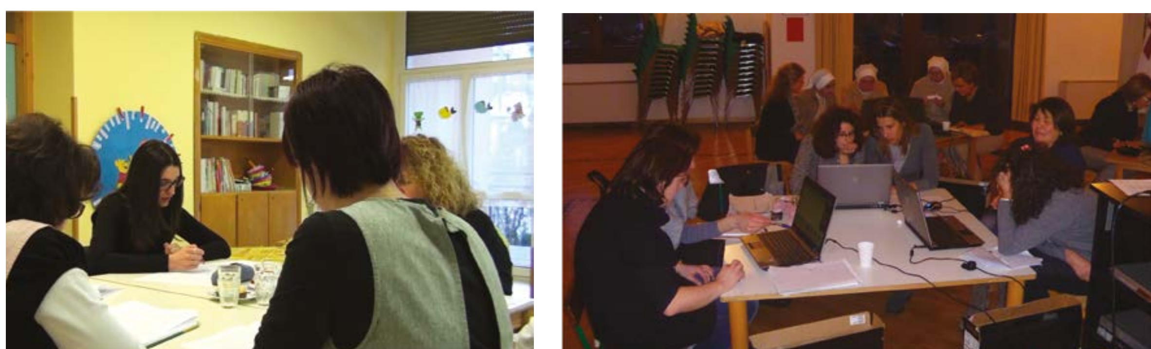
Gruppi di insegnanti che progettano insieme , in alcuni passaggi con la preziosa azione di accompagnamento e di supporto del coordinatore

« Le attività di progettazione, di riflessione, di analisi delle interazioni educative devono essere pubbliche e condivise, oltre che sostenute da scritture professionali, da materiali video e da osservazioni. Fare questo lavoro con i colleghi della propria scuola – e se possibile anche di altre scuole – sostiene, come tutte le situazioni sociali, un processo analitico e riflessivo più ricco, proprio perché maggiormente discusso e negoziato» (Monaco, Zucchermaglio, 2021, p. 35)