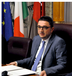
Maurizio Fugatti Presidente Provincia autonoma di Trento

Q uesta edizione 2020 del Festival della Famiglia prende avvio in un particolare momento della nostra comunità e inevitabilmente cerca di interrogarsi sulle questioni poste, con drammatica urgenza, dalla crisi generata dalla pandemia da Covid-19. Una crisi certamente sanitaria, ma con profondi risvolti economici e sociali, che investono direttamente la nostra sfera personale di uomini e donne, costringendoci a modificare abitudini, comportamenti e relazioni affettive.